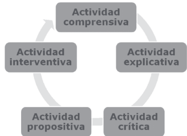
Figura 2. Ciclo de la autoevaluación reflexiva

aprendizaje, sobre los alumnos, etc.) y estratégico (saberes procedimentales para una docencia relevante y eficiente).